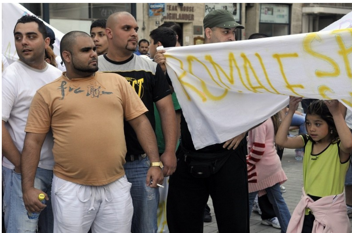
Czescy obrońcy praw człowieka protestują pod hasłami „miłość”, „pokój”, „tolerancja”