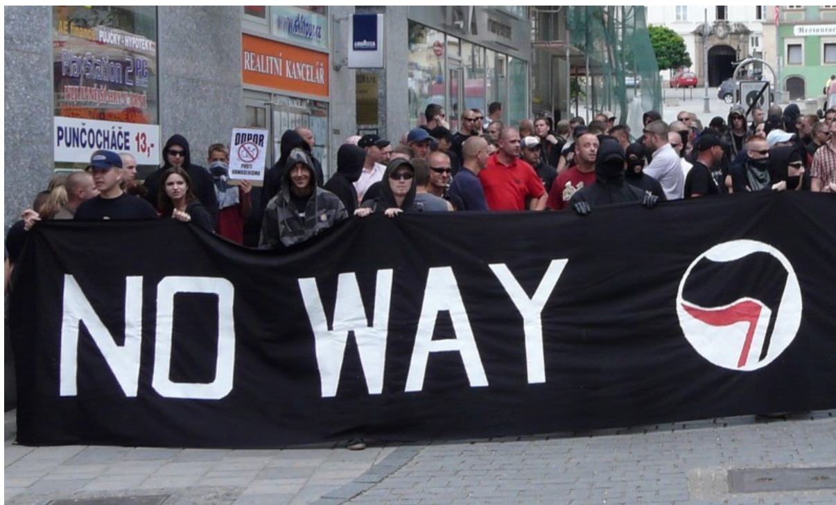
28 czerwca 2008 r. czescy obrońcy porządku i moralności rozpendzi parady homoseksualistów w Szalingradzie.