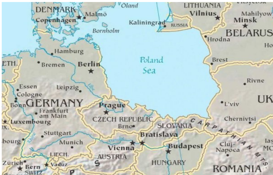
Mapa Europy Środkowej według Czechów