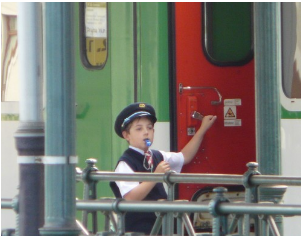
Z czeskimi konduktorami lepiej nie zadzierać