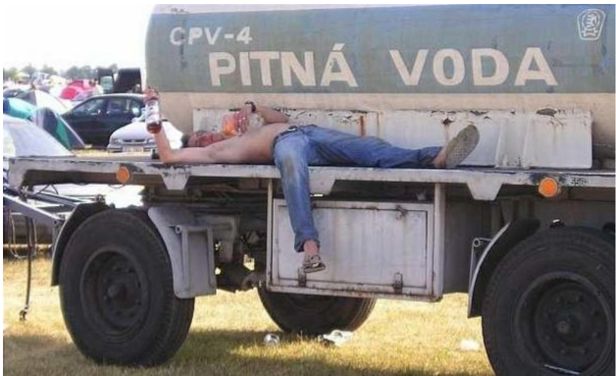
Czeska „kranówka” słynie z właściwości leczniczych