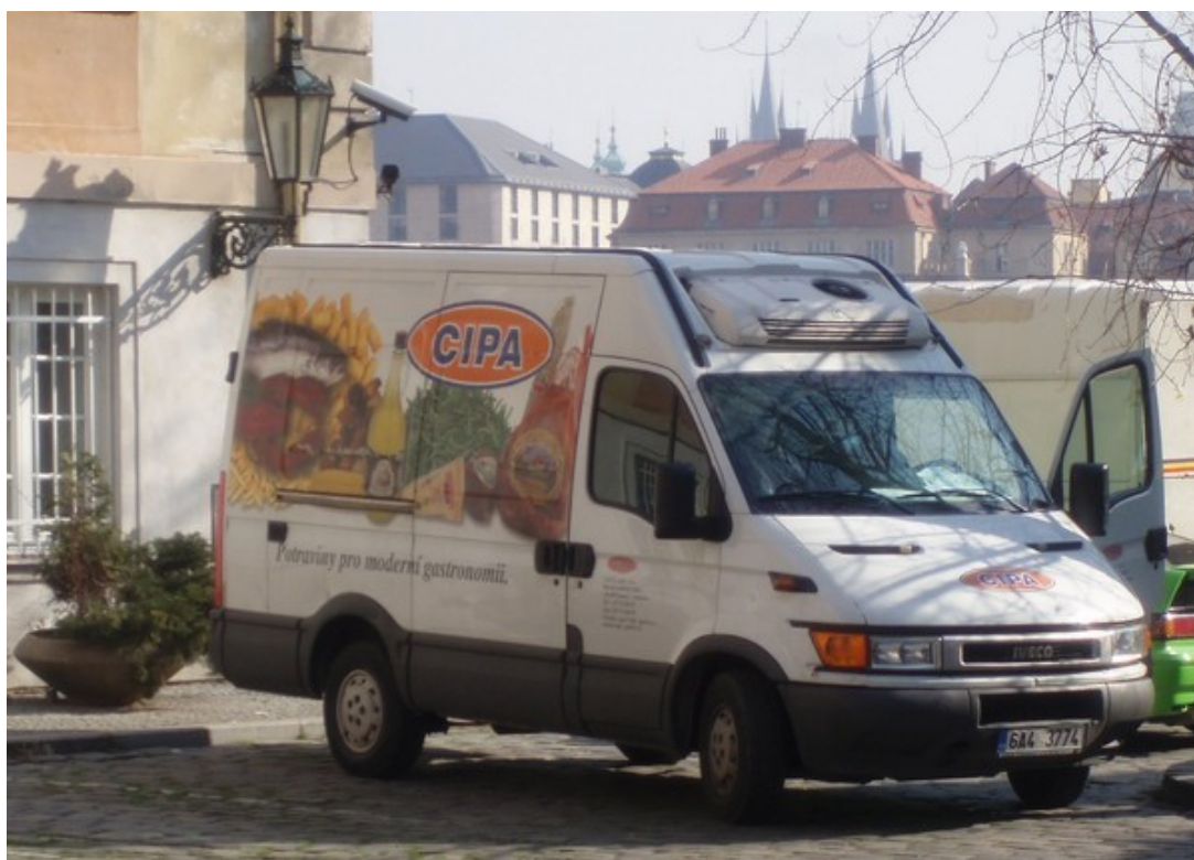
W Pradze można znaleźć wiele słynnych firm gastronomicznych