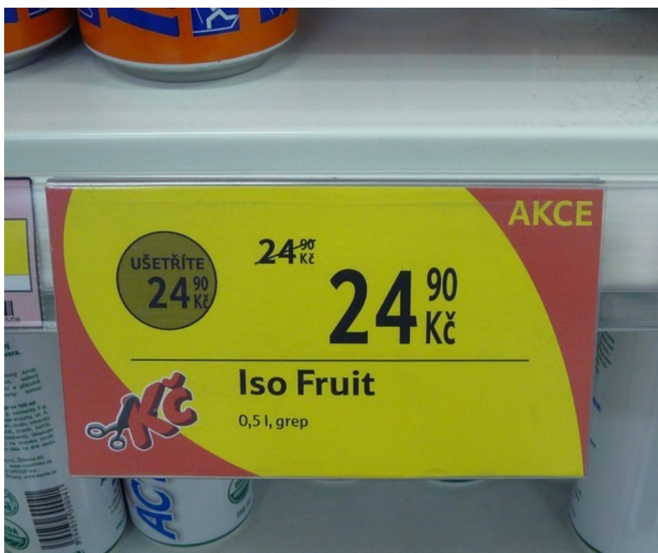
W czeskich sklepach možna natrafić na ciekawe promocje