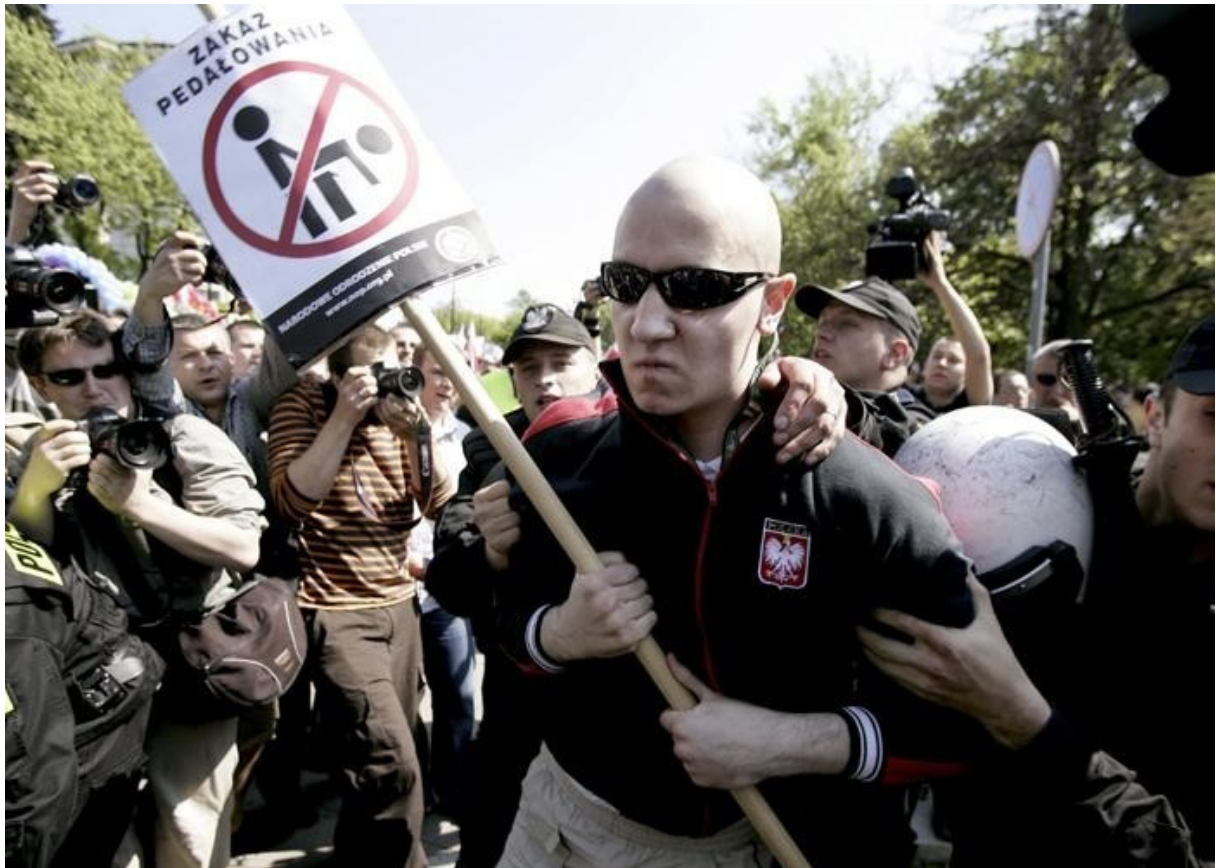
Tak Czesi wyobrażają sobie przeciętnego Polaka