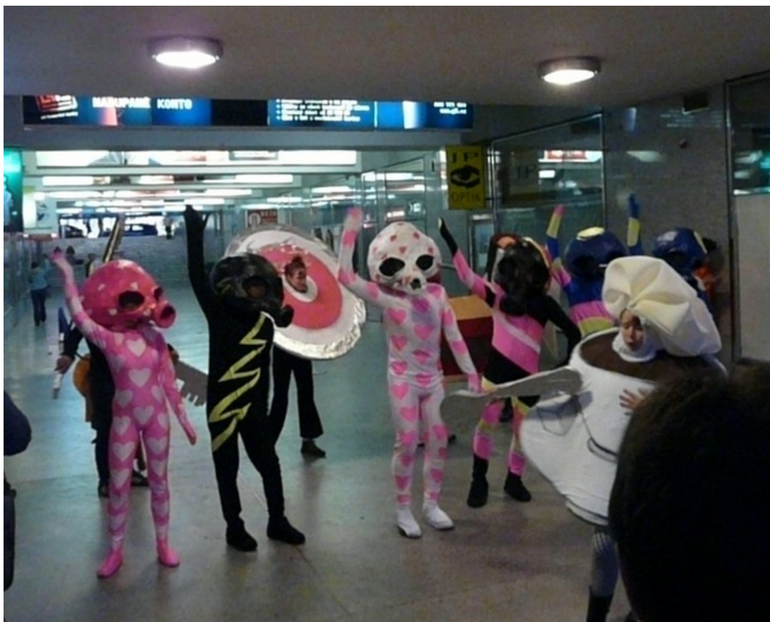
2040 – Inwazja Marsjan na Czechy