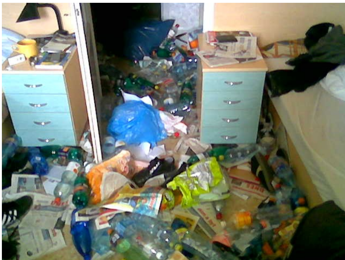
Pokój w czeskim akademiku – wersja standard