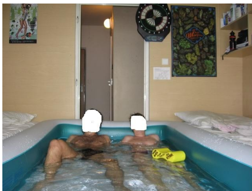
Pokój w czeskim akademiku – wersja deluxe