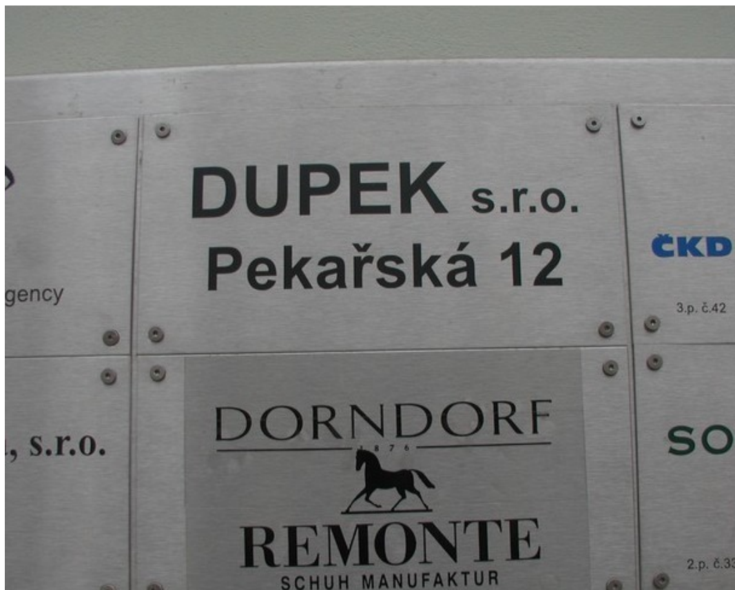
W Czechach najczęściej firm działa jako s.r.o., czyli spółka z.o.o.