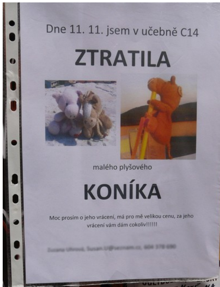
Ogłoszenie na tablicy ogłoszeń jednej z uczelni